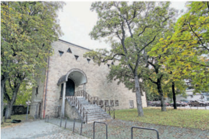
Die Trierer Synagoge.