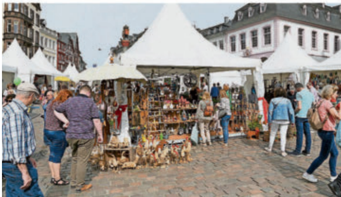
Trierer Frühlingsmarkt auf dem Hauptmarkt.