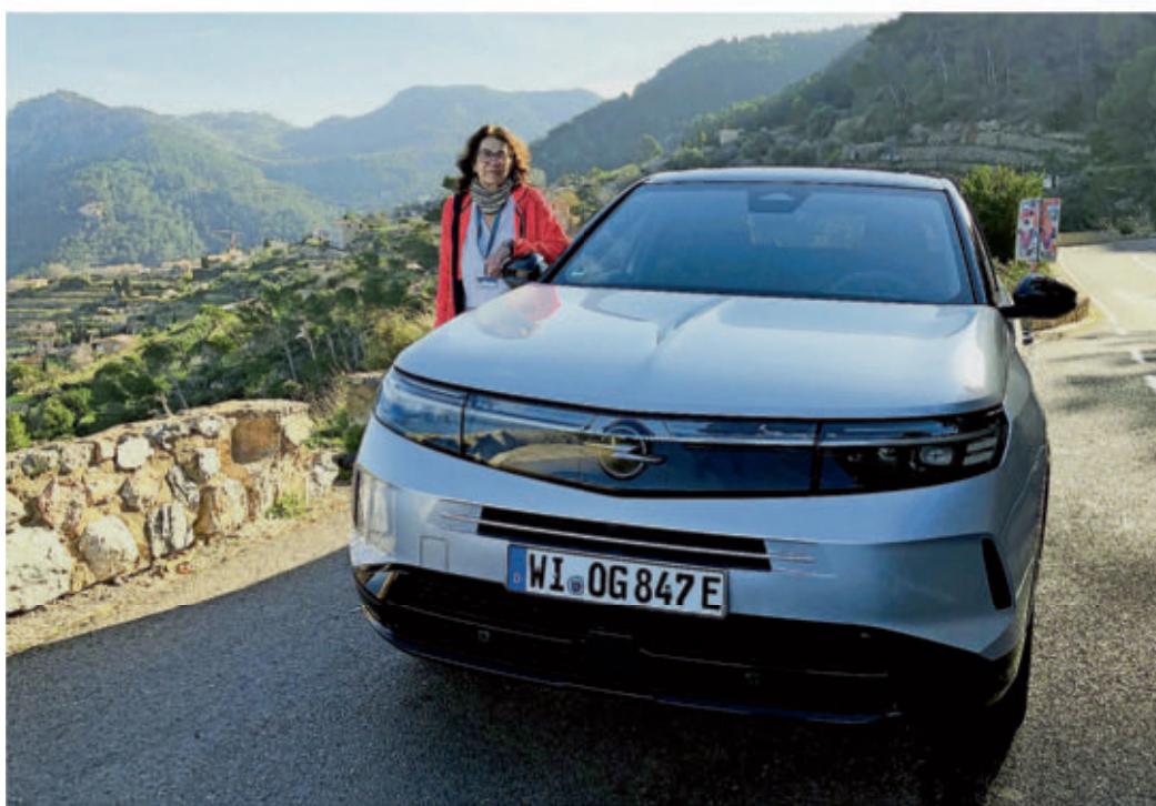
Der Plug-in-Hybrid füllt jetzt die Lücke zwischen Hybrid und Elektro.

TRIER Nachdem kürzlich der neue Opel Grandland 48-Volt und Electric eingeführt wurde, ist ab sofort auch der neue Grandland mit Plug-in-Hybrid bestellbar. Die Preise für den Teilzeit-Stromer, der in zwei Ausstattungsvarianten erhältlich ist, beginnen bei 40.150 Euro. Mit im Gepäck hat der neue Plug-in-Hybrid, der in Rüsselsheim entwickelt wurde und in Eisenach vom Band läuft, einen komplett neu entwickelten Benzinmotor. Das 4,65 Meter lange, 1,93 Meter breite und 1,66 Meter hohe Opel-SUV kommt mit viel Platz für fünf Personen und deren Gepäck daher. Hinter der Heckklappe können – je nach Sitzkonfiguration – zwischen 550 bis maximal 1645 Liter Gepäck verstaut werden. An den Haken kann der Rüsselsheimer Plug-in-Hybrid 1500 Kilo nehmen. Innen fühlt sich das knapp zwei Tonnen schwere SUV mit seinem Radstand von 2,78 Meter luftig und geräumig an. Angetrieben wird der Teilzeitstromer von einem 1,6-Liter Turbo-Vierzylinder mit Direkteinspritzung der 150 PS leistet. Unterstützt wird er von einem im Getriebe sitzenden 125 PS starken Elektromotor. Die Gesamtsystemleistung beträgt 195 PS bei einem maximalen Drehmoment von 350 Nm. Die Kraft wird mittels eines neuen Sieben-gang-Doppelkupplungsgetriebes auf die Vorderräder gebracht. Im