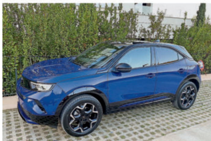
Sein kleinstes SUV, den Mokka, hat Opel jetzt mit einem Facelift aufgewertet.

meter (WLTP) bis zum nächsten Ladestopp zurücklegen können. Geladen wird an Schnellladestationen in 27 Minuten auf 80 Prozent. In neun Sekunden sprintet der E-Mokka auf 100 km/h, bei 150 km/h ist Schluss. Das Antriebssystem des 48-Volt-Mokka besteht aus einem 136 PS starken 1,2 Liter Dreizylinder-Turbo-Benziner, unterstützt vom 28-PS-Elektromotor. Die Kraft wird von einem elektrifizierten Sechsgang-Doppelkupplungsgetriebe auf die Vorderräder gebracht. Den Sprint von null auf 100 meistert der 1.362 Kilo-SUV in 8,2 Sekunden. Bei 209 km/h ist Schluss. Opel bietet den in zwei Versionen (Edition und GS) erhältlichen Mokka neben der 48 Volt-Version auch mit manuellem 136 PS Verbrenner (ab 26.740 Euro), 130 PS Automatik-Verbrenner (ab 28.740 Euro) und mit 156 PS starkem Elektroantrieb (ab 36.740 Euro) an.