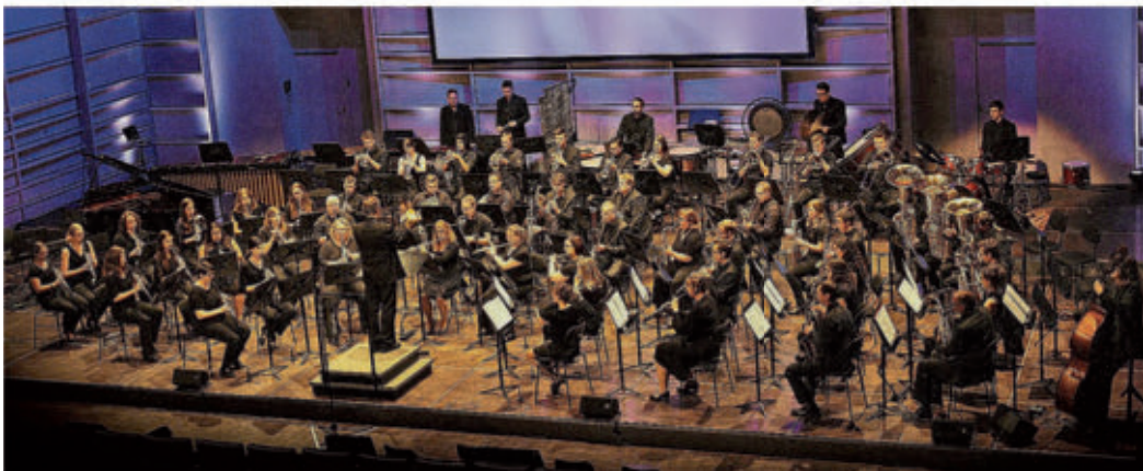
Sinfonisches Blasorchester Bitburg-Prüm.

Hier ist für jeden was dabei: Trierer Frühlingsmarkt, Kabarett, Klassik und Singer-Songwriter-Pop